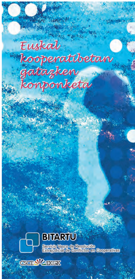
Bitarturen aurkezpen liburuxka

prebenitzea eta kooperatibistak gatazken ebazpenean prestatzea, ikastaro, programa eta abarren bitartez. Horren guztiaren helburua zera zen: Kontseiluaren txostenek erakusten zutenez, hala bertako zereginaren ezagutzari nola esku hartutako gatazken kopuruari zegokienez, ikaragarri handitu zen espazio batean hobeto jardutea. 13