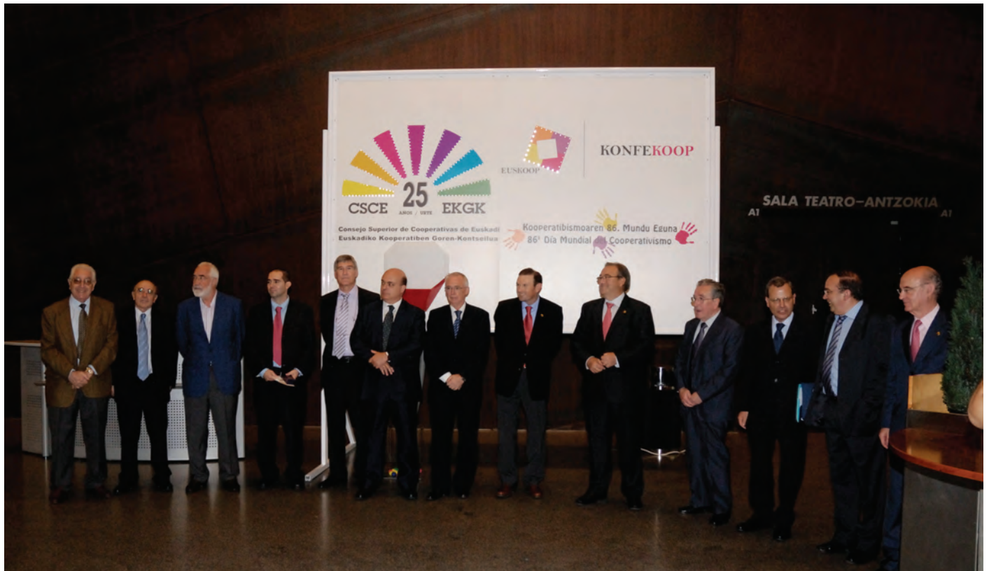
EKGKren 25. Urtemugako ospakizuna Bilboko Euskalduna Jauregian

bidualetara hurbiltzeko ahalegina sustatzea, haien kezkek ezagutu eta kezkek tratatzeko eztabaidarako foro birtualak edo presentziakozkoak sortzeko helburuaz. Era berean, Eusko Jaurlaritzarekiko akordio ereduak beste erakunde publiko batzuetara hedatzeko asmo sendoa agertu du.